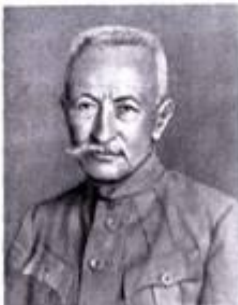
Брусилов А.А. 1853-1926

Генерал-адъютант, военный писатель, профессор академии.