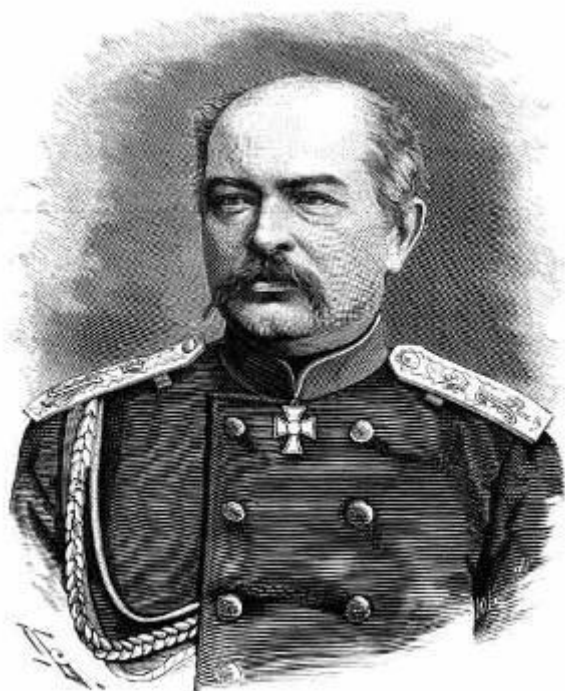
Драгомиров М.И. 1830-1905

Генерал-адъютант, военный писатель, профессор академии.